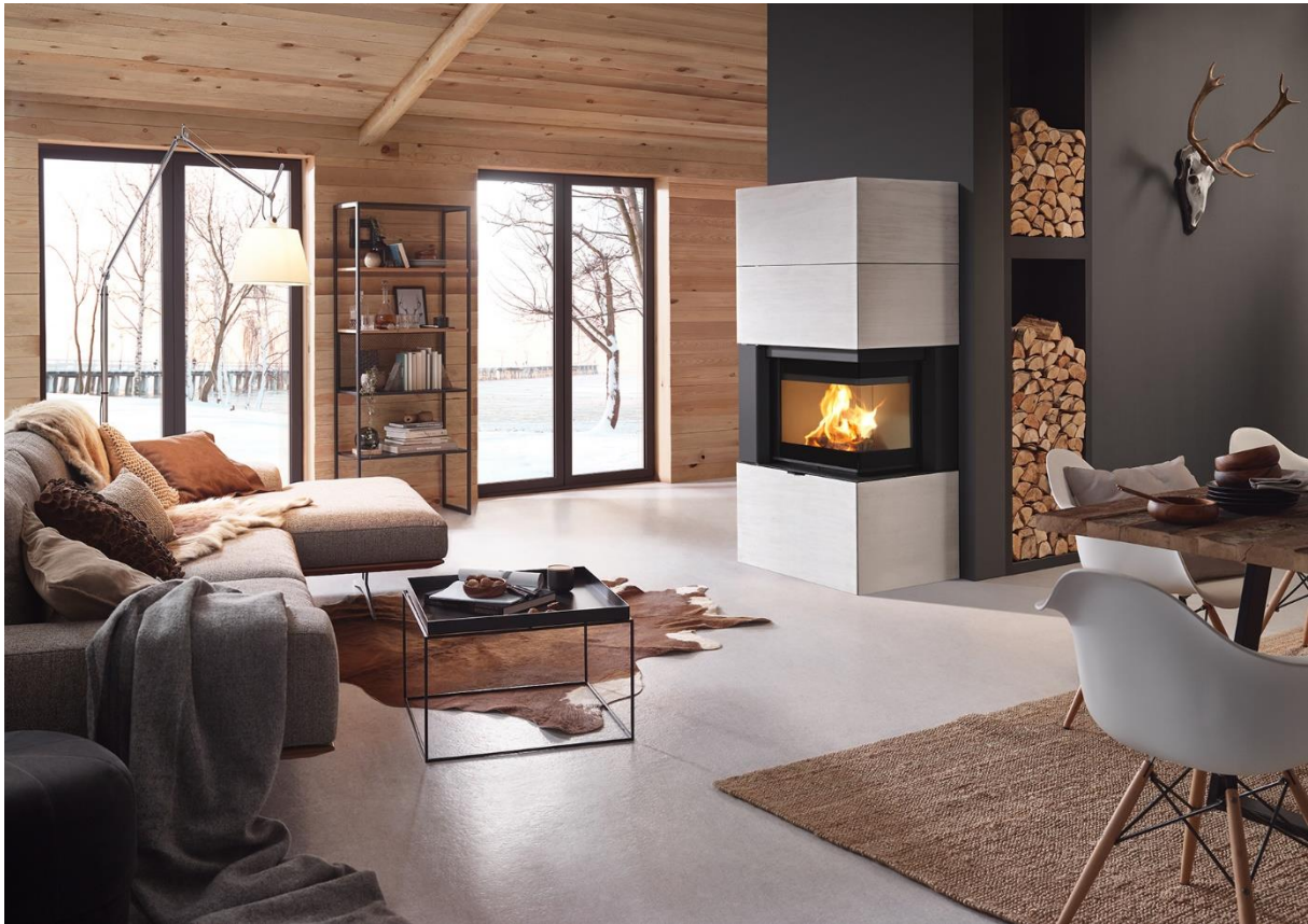
Ein Ofen für anspruchsvolle Individualisten ist der Designkamin SYMBIA von RIKA.