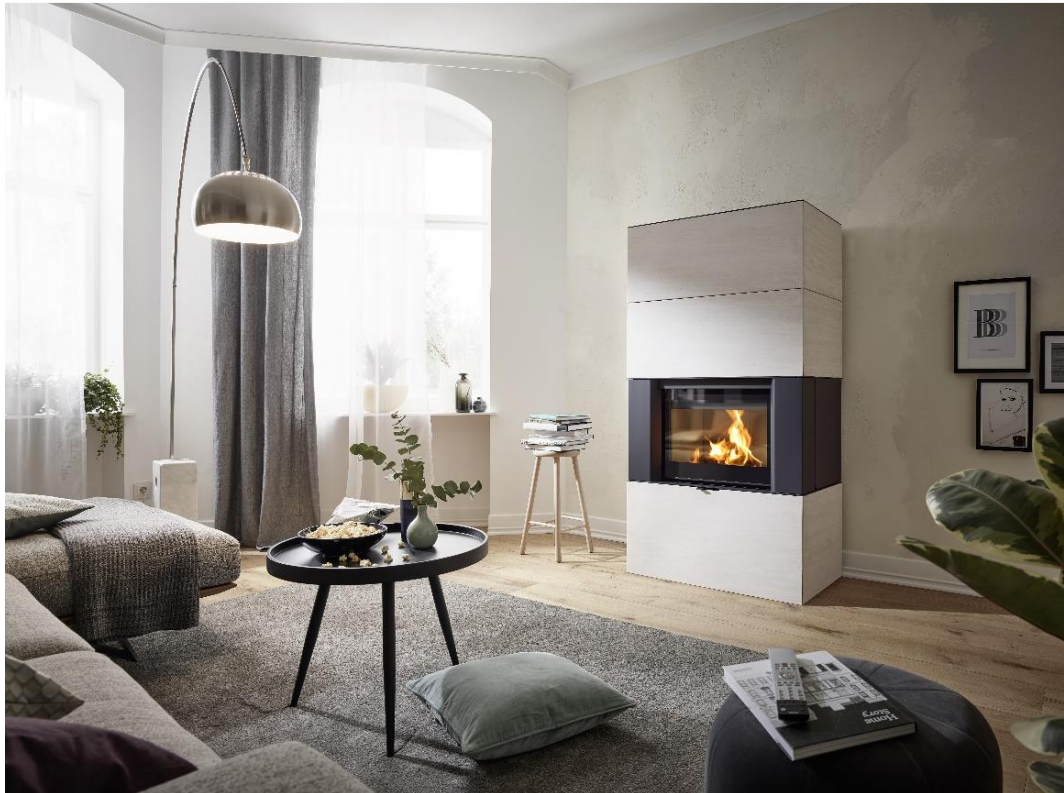
Unvergleichbare Atmosphäre im Wohnraum mit dem Designkamin AMBIA von RIKA.

bieten darüber hinaus zahlreiche Gestaltungsmöglichkeiten. Das hochwertige Rahmensystem ist zudem einfach zu montieren.